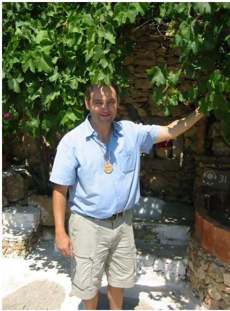
Museumsdirektor Yiannis Markakis

Das Museum funktioniert als Raum für aktive Volkskunde und Erziehung. Sein Ziel ist, dem Besucher die Naturelle Umwelt und Volkskunde Kretas anschaulich zu präsentieren; siehe dazu auch nachfolgende, unkommentierte Bilder.