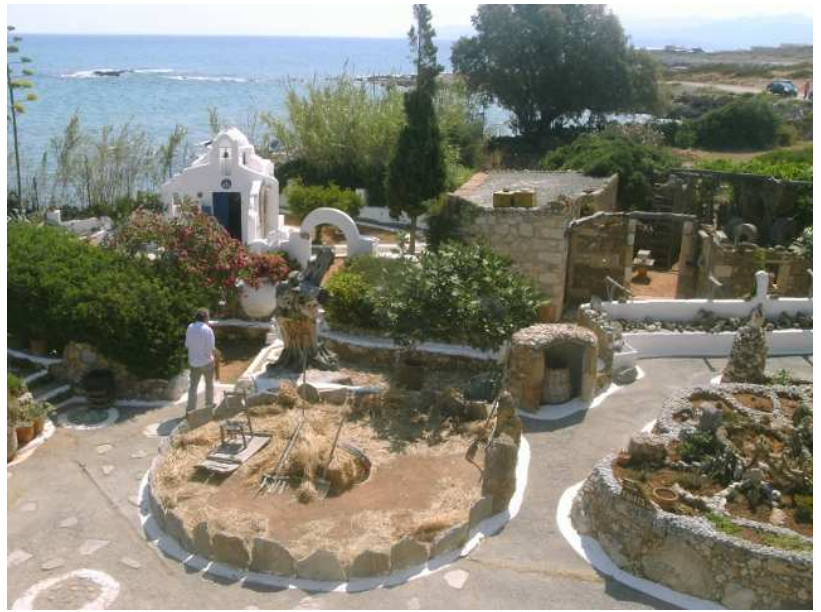
Blick auf einen Teilbereich der Museumsanlage mit Kapelle