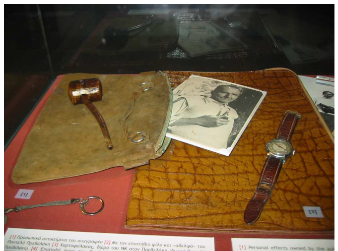
[1] Προσωπικά αντικείμενα του συγγραφέα [2] Με τον επιστήθιο φίλο και -αδελφό- του Παντέλη Πρεβελάκη [3] Κατοφυλάκιος, δώρο του ΝΚ στον Πρεβελάκη (δωρεά Παναγιώτη Πρεβελάκη) [4] Επιστολή προς τον Παναγιώτη Πρεβελάκη