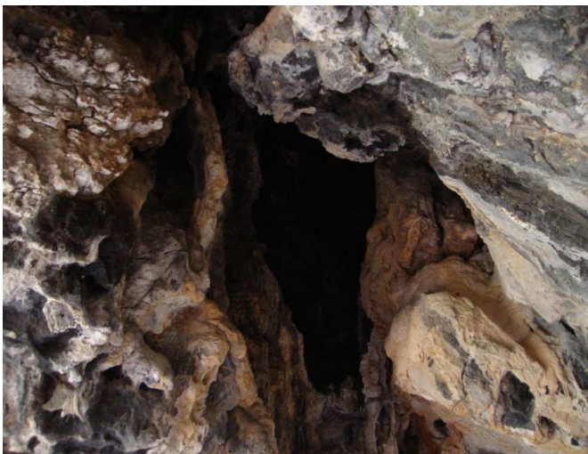
Durchstieg in eine kleinere Kammer