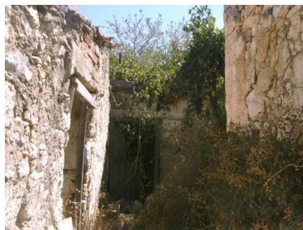
Verfallene Häuser in „Alt Adrianos“