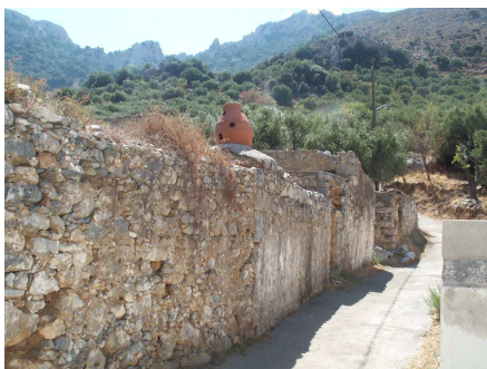
Weg durch „Alt Adrianos“

Die nachfolgenden Abbildungen zeigen (mit Kurzkommentaren) Impressionen von der Wegstrecke und der Höhle: