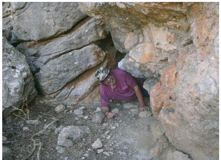
Sehr „eng“ ist der Seitenausstieg