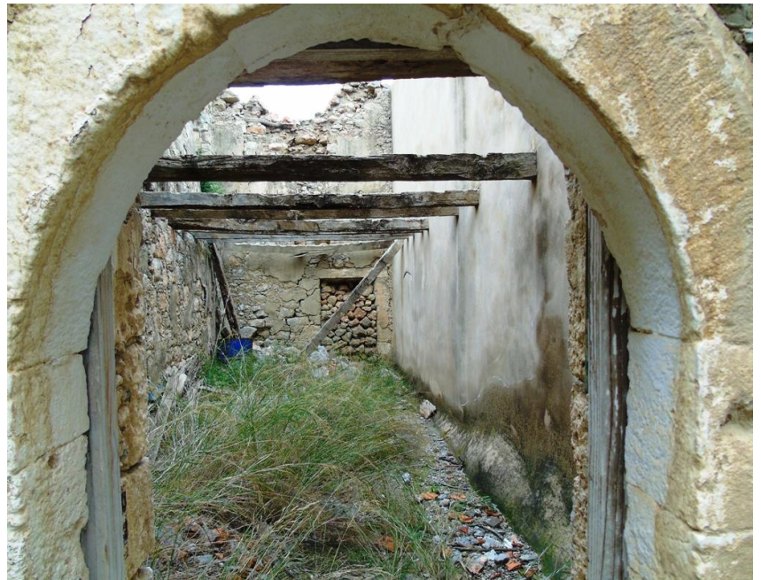
März 2023