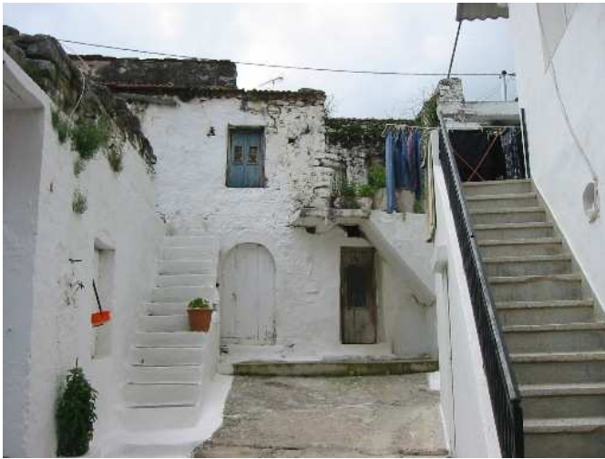
Ένα σπίτι στον κεντρικό δρόμο