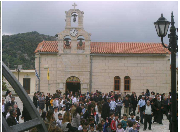
Εικόνες από το προαύλιο της εκκλησίας κατά τη διάρκεια (αρ.) και μετά τη θεία λειτουργία (δε.)