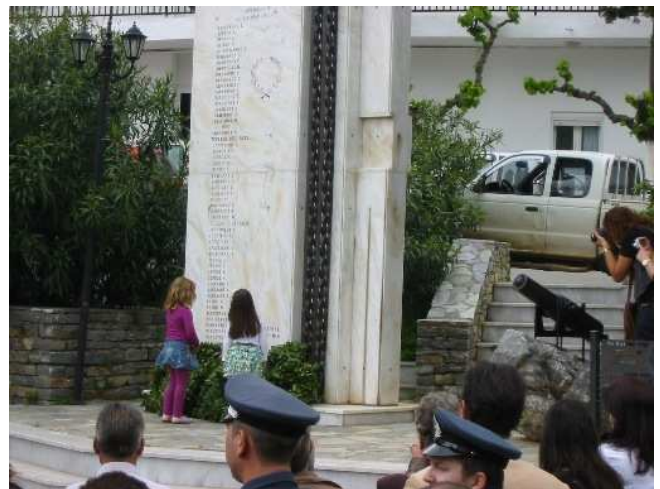
Νέοι και παιδιά του χωριού συγκεντρώθηκαν στον δρόμο για μία “παρέλαση” μέσα από τα Ζωνιανά (βλ. φωτό ).