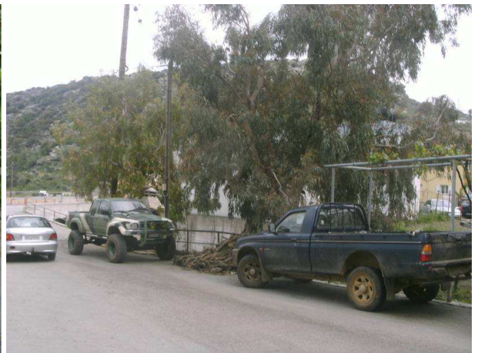
Το αγροτικό του παπά σε χρώματα καμουφλάζ