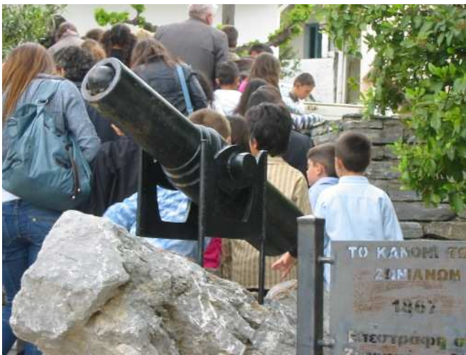
Το τουρκικό κανόνι, 144 χρόνια στα Ζωνιάνα