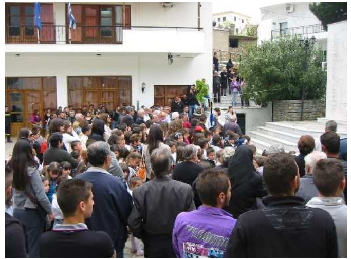
Συγκέντρωση μπροστά από το Μνημείο