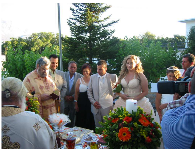
Εικόνα αριστερά: Οι γονείς του γαμπρού με την νύφη και τον γαμπρό. Εικ. δεξιά: το ζευγάρι, οι γονείς του γαμπρού και ο κουμπάρος του γαμπρού πριν αρχίσει η τελετή.