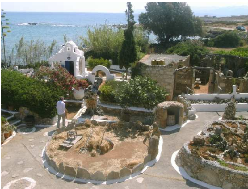
Θέα σε ένα τμήμα του μουσείου με το παρεκκλήσι